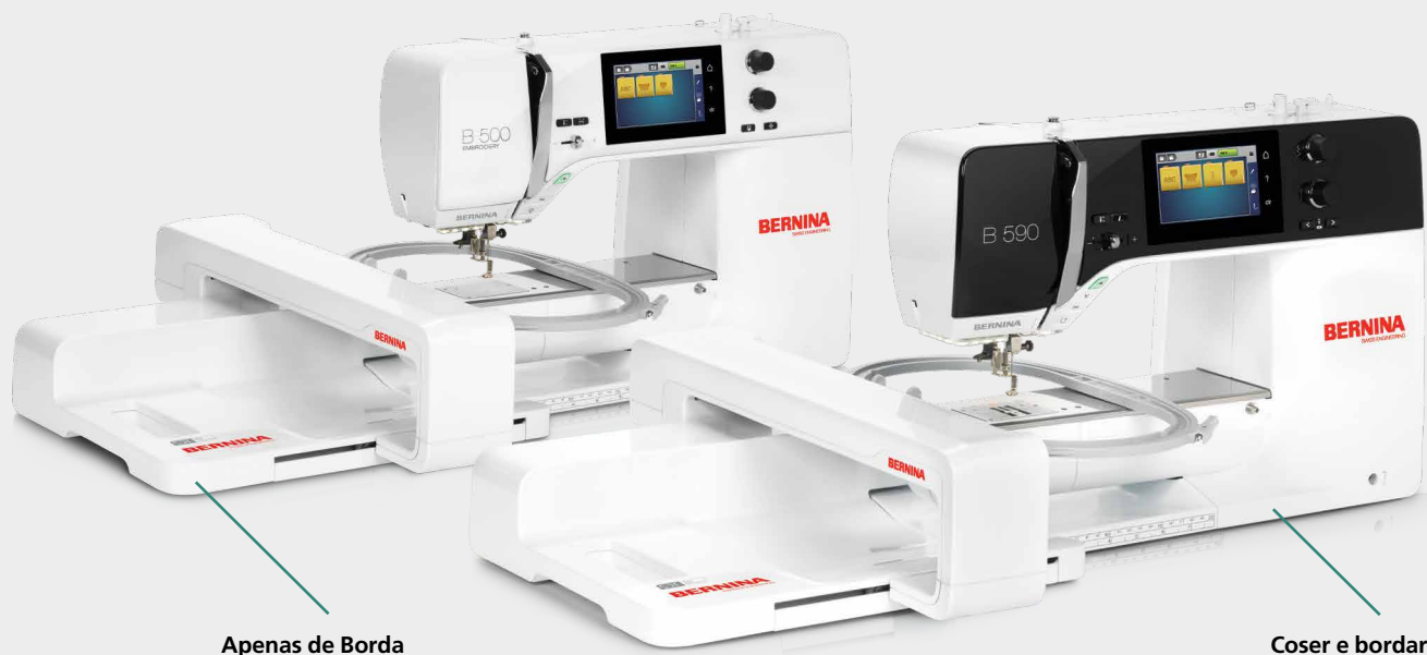
Apenas de Borda