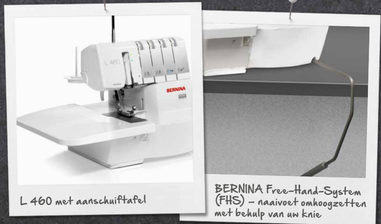
L 460 met aanschuiftafel

Het goed verlichte grote werkoppervlak van deze overlocker vereenvoudigt het naaien en het inrijgen van grijpers en naalden. Dankzij het Free-Hand-System (FHS), dat de naaivoet omhoog en omlaag zet, zijn beide handen vrij voor het naaien en het plaatsen van de stof. De aanschuiftafel vergroot het werkoppervlak en vergemakkelijkt het verwerken van grote naaiprojecten.